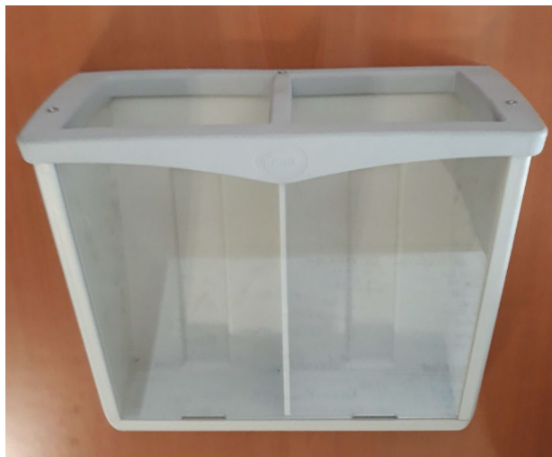
Código de almacén: 203872

En una de las mamparas situadas en las puertas de salida, se montará un portafolletos centrado en la misma. El sistema de fijación es mediante adhesivo incorporado en el portafolletos y se realizará según plano y cotas adjuntas.