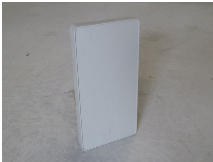
Código de almacén: 206810

En la parte superior de cada una de las validadoras se montará un soporte para la colocación del adhesivo informativo (204719).